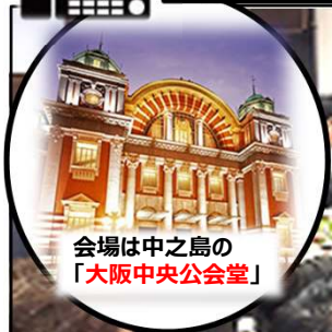
会場は中之島の「大阪中央公会堂」

最下部の必要事項ご記入の上、FAX番号06-6943-7222までお送り下さい。